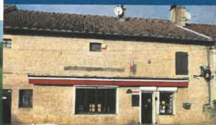
L'ÉTRIER BAR - TABAC - JEUX

En dépit du soulagement que cela procure en période de chaleur, la baignade est interdite dans le canal pour raisons de sécurité.